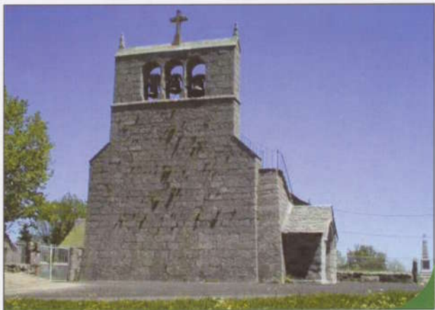
Le clocher peigné de la Trinitat

Sur les plateaux d'Aubrac le remembrement n'ayant pas encore fait son apparition, vous pourrez voir tous ces murs de pierres qui existent encore, témoin du formidable travail des hommes.